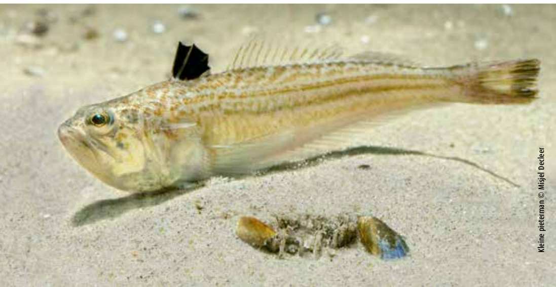
Kleine pieterman