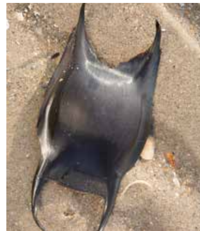
Eikapsel van stekelrog