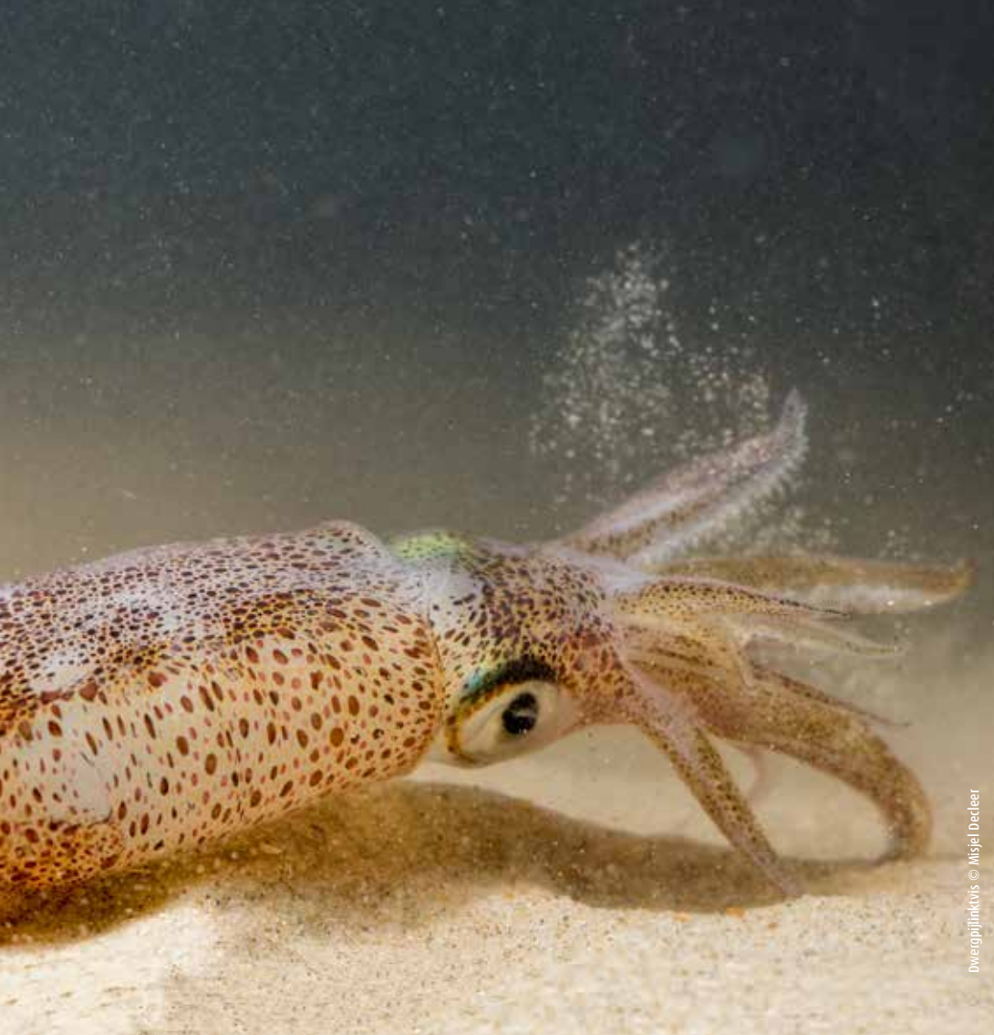
Dwergrijnkvis © Mijel Decler