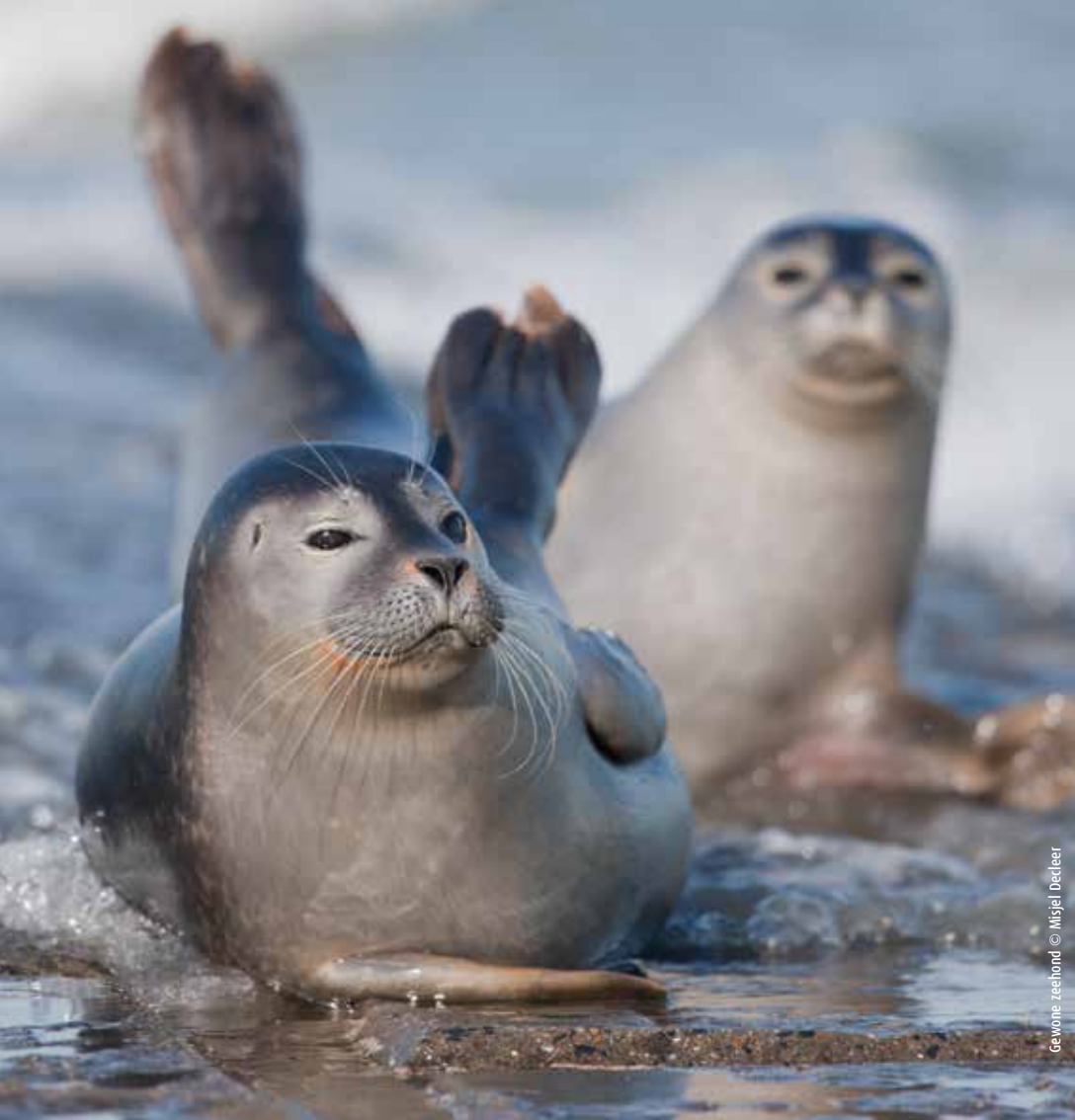
Gewone zeehond © Misjel Decler