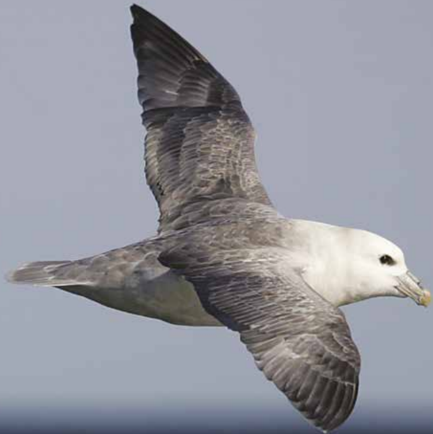
Noordse stormvogel