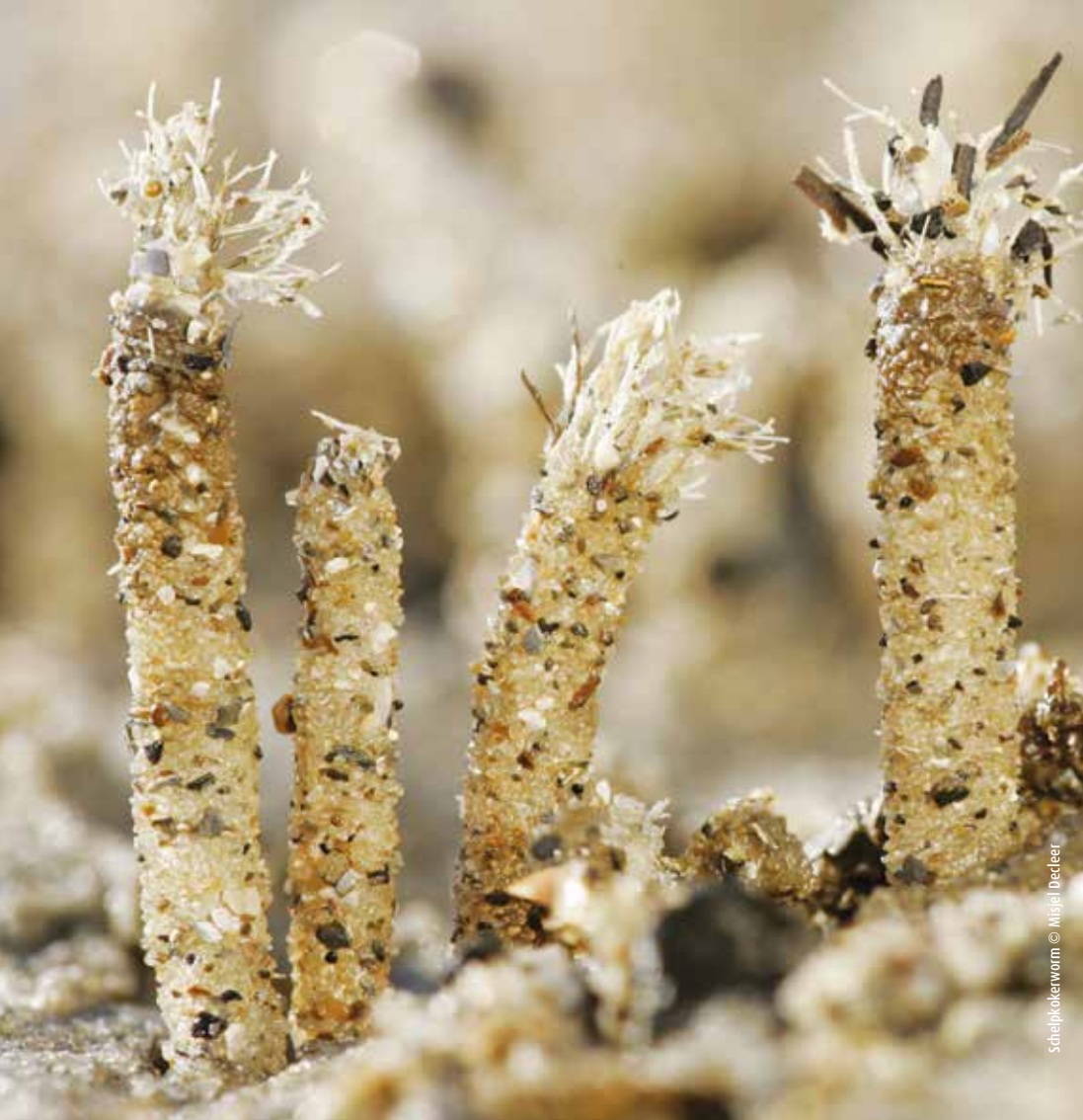
Schelpkokerworm © Mijiel Deleer