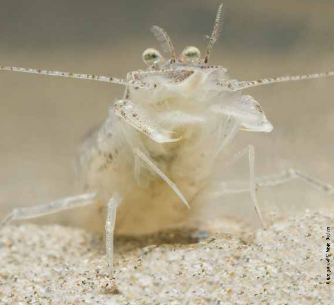
Grijze garnaal