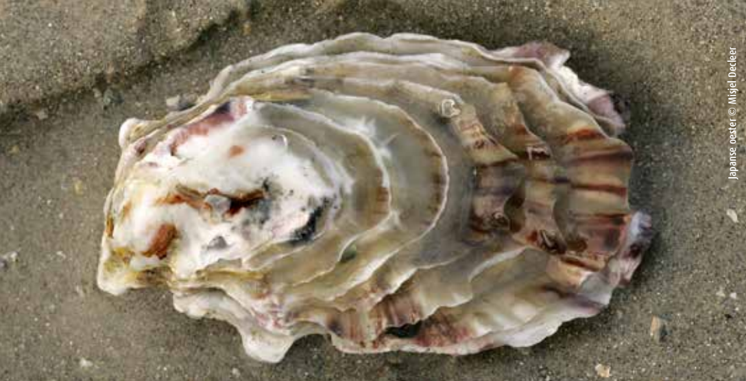
Japanse oester