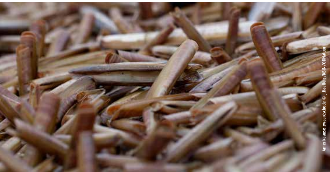
Amerikaanse zwaardschede